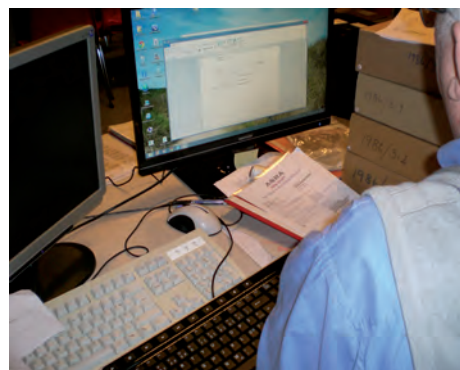
Pladsen er trang, men der arbejdes ihærdigt