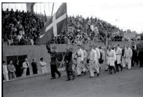
Den store indmarch ved en af festerne