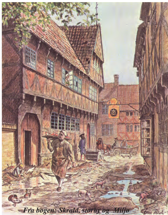
Fra bogen: Skrald, storby og Miljø