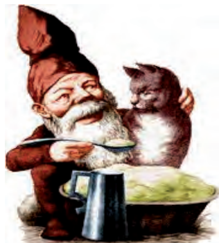
Nissen fik et fad risengrød.