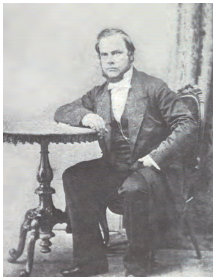
L.A.Colding 1815 - 88 var ophavsmanden til den store vandforsyning i storbyen

I det meste af 1800 tallet var fejningen af de offentlige pladser og torve overdraget til fattigvæsenet.