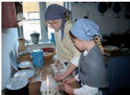
Mor og yngste datter i køkkenet, de andre piger i familien, er ude og tjene.

Når julemiddagen var fortæret, så man frem til julenatten - som visse steder i landet indbød hele husstanden - også karle og piger på gården, til at sove sammen i »julehalmen«. Man sov i stuen, hvor der var strøet rigeligt med halm, derved delte man leje med frelseren. Samtidig havde man sikret ekstra soveplads til de af familien afdøde medlemmer, som i julen valgte at vende hjem.