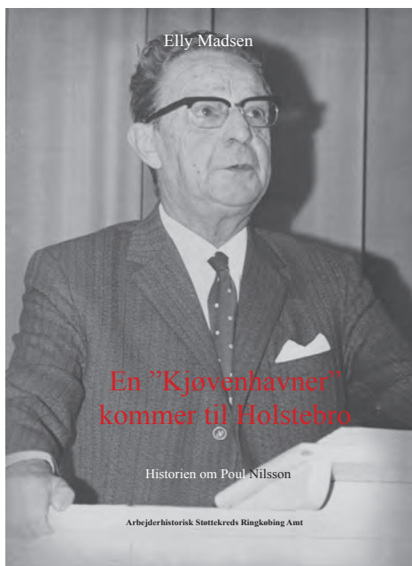
Forsiden af Poul Nilssons bog

Men de fleste af dem, de havde sgu ingen tændstikker. Og så om morgenen, hvis de var deroppe, så sagde han: "Kom ned og få en kop kaffe." Men for de flestes vedkommende, så der, når klokken var 5, så var de stukket af.