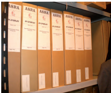
Arkivkasserne får nye etiketter efterhånden som de bliver gennemgået og nyregistreret