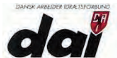
Dansk Arbejder Idrætsforbunds logo

Idéen med at lade fagene konkurrere var kendt i andre lande, men først her blev alle fag repræsenteret under ét. I 1980'erne blev Fagenes Fest taget op igen i flere købstæder, fra 1987 i Fælledparken i København. I starten af 2000-t. fejres Fagenes Fest ikke længere.