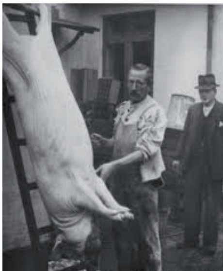
Juleslagtingen foregik på gårdspladsen