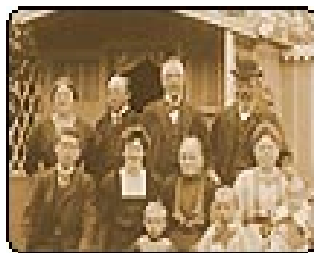
Arbejderfamilie i kolonihaven

Det er en interessant og tankevækkende udstilling der er værd at se.