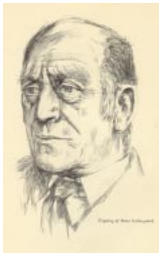
Oskar Hansen - Den store bevægelses digter