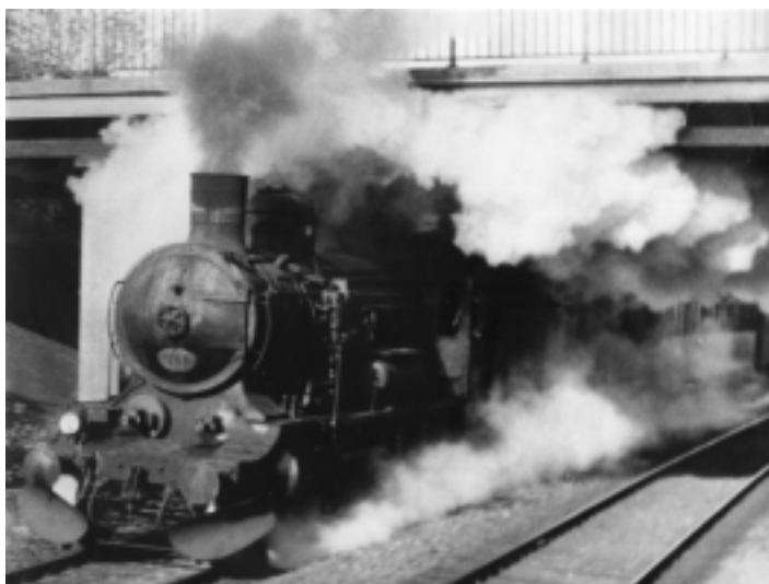
Tog 20 - fremført af P 911 - på vej ud af Slagelse station, mod København

sikkerhed, vognlære, rapportkrivning , m.v. Efter to års aspiranttid, den 1. oktober 1952, kom udnævnelsen til lokomotivfyrbøder. Og heldigt for mig, i Korsør. Her gjorde jeg tjeneste indtil 1. marts 1962, hvor jeg hovedsagelig kørte mellem Korsør og København, på litra E og P. Og enkelte ture med litra D og S.