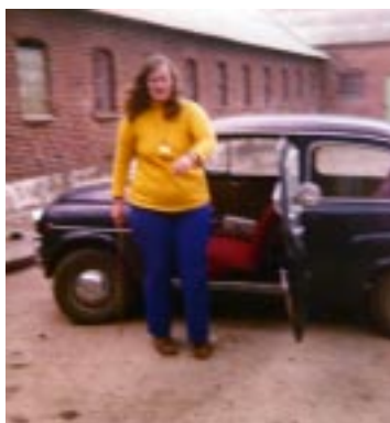
Inges lille Fiat 500

Da jeg blev 18 år, kunne jeg tjene endnu mere i industrien og have fri hver weekend. Der kunne også blive råd til en lille bil, en Fiat 500.