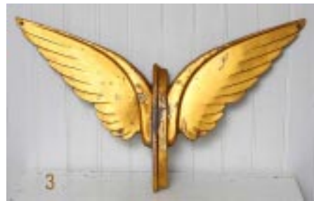
Det smukke gamle DSB vingehjul blev brugt til 1973

Sovevognstoget - tog 95 - fra København til Jylland, til de ovennævnte destinationer, kørte fra Københavns Hoved- banegård omkring midnat.