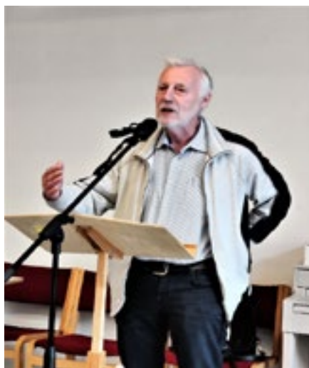
Fhv. Folketingsformand Henrik Dam-Kristensen

En meget spændende beretning, som han slutte af med et stort tillykke til ASRA med de 40 år, og da han nu var gået ud af politik, så skulle han nok bevare traditionen, og komme igen til ASRAs 50 år jubilæum.