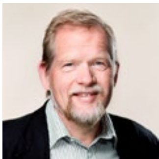
Christian Juhl (EL)