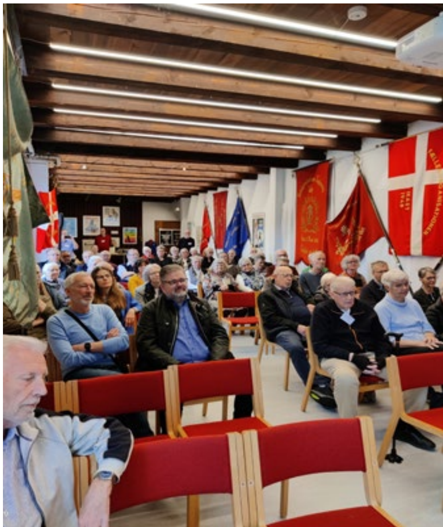
Fra ASRA's 40 års fødselsdagsfest den 15. april 2023 i Historiens Hus.