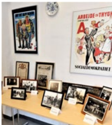
Billeder fra arbejdspladser og forskellige kongresser m.m.

Vi er så heldige, at mange af billeder er identificeret, så man kan beskrive hvor de er taget, og hvem der er på dem