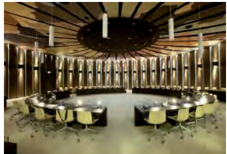
Regionsalen i Viborg Arkiv foto