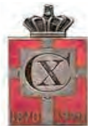
Kongemærket for Christian d.X

Så i bund og grund er vi alle, i en eller anden grad, nostalgikere. Heldigvis for det.