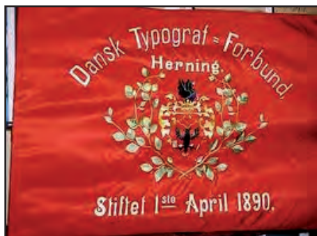
En af de flotte faner i vores arkiv

ASRA gemmer arbejderhistorie til eftertiden, i en tid hvor alt bliver digitaliseret.