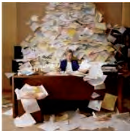
Det papirløse samfund skulle helst ikke se ud som på dette billede.

Det er vigtigt og det skal gøres grundigt og ordentligt, men det bliver sandelig også en spændende og interessant opgave.