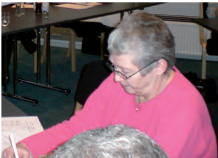
Sekretæren skriver flittigt

Private medlemmer er uændret kr. 125. For partiforeninger ændres til kr. 125. Andre foreninger uændret kr. 200, og faglige organisationer ændres til kr. 500. Det foreslåede blev vedtaget.