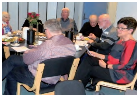
medlemmerne følger aktivt med

I 2013 har Herning 100 års købstads-jubilæum, og efter de første oplæg er det svært at få øje på, at der har boet lønmodtagere i Herning kommune. Efterfølgende har medlemmer af bestyrelsen været i kontakt med formanden for LO Herning, om aktiviteter i anledning af 100 års jubilæet. Forslag til forskellige aktiviteter er allerede bragt på bane. Bl.a. afholdelse af fælles 1. maj for hele fagbevægelsen i Herning. Som tidligere nævnt har vi fået ny medlemmer, men vi mister også medlemmer, og i forbindelse med fusioner indenfor fagbevægelsen, mister vi faglige afdelinger som medlemmer. Så hvis ASRA fortsat skal bestå, skal der hverves nye medlemmer, bredt i hele ASRAs område.