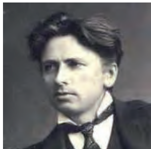
Jeppe Aakjær arkiv foto

Jeg undskylder, hvis jeg har stødt nogen. Men sådan forestiller jeg mig sangen var ment. /b