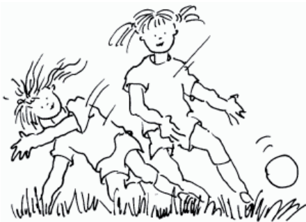
Pigefodbold er supersjovt