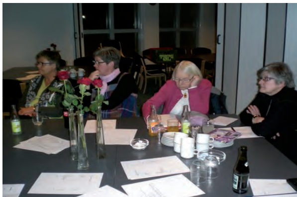
Deltagere i generalforsamlingen

Vedtægterne blev fremlagt i revideret form, godkendt og vedtaget på ASRAs generalforsamling på 3F. - Birk den 29. februar 2012.