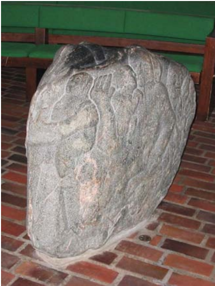
Døbefonden i Baunekirken - Herning

Som i så mange andre kirker er der en lille folder der omtaler kirken og dens inventar, og heri kunne jeg til min store overraskelse se, at kirkens døbefond var lavet af billedhuggeren/stenhuggeren Torvald Westergaard fra Lemvig.