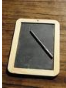
Tavle og griffel

ruttede ikke med hæfter og lignende til øvelsesbrug.