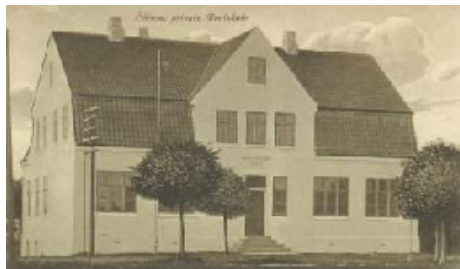
Skjern private Realskole 1922

Det var noget af en omvæltning at komme på realskole, men spændende, for nu skulle man jo til at lære både tysk, engelsk og fransk. Matematik var også et ganske nyt fag.