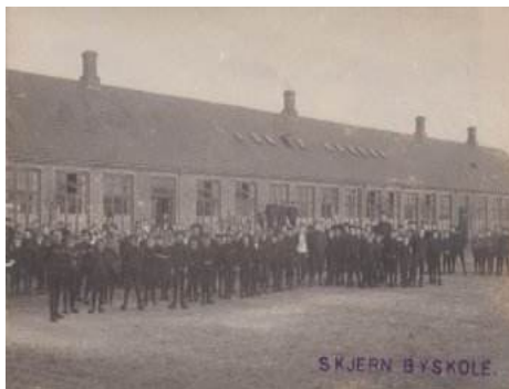
Skjern byskole ca. 1910