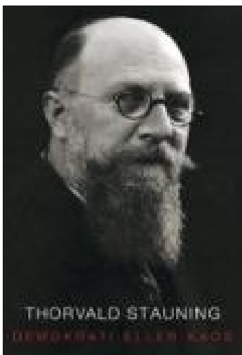
Demokrati eller kaos - en biografi