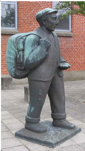
Uldjyden i Vestergade - Herning