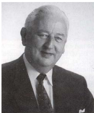
Fhv. Borgmester i Herning Hilmar Sølund

I dette nummer af ASRA NYT bringer vi en barndomserindring fra Skjern.