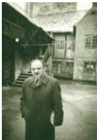
Anker viser rundt i sit bardomskvarter

baggrund, har statsministerposten været varetaget af en socialdemokrat i godt 52 ud af de forgangne 76 år. De 8 socialdemokratiske statsministre i det 20. århundrede har været Thorvald Stauning, Vilhelm Buhl, Hans Hedtoft, H.C. Hansen, Viggo Kampmann, J.O. Krag, Anker Jørgensen og Poul Nyrup Rasmussen.