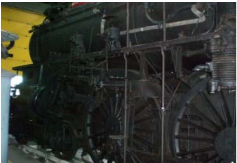
Hjul - næsten i menneskehøjde