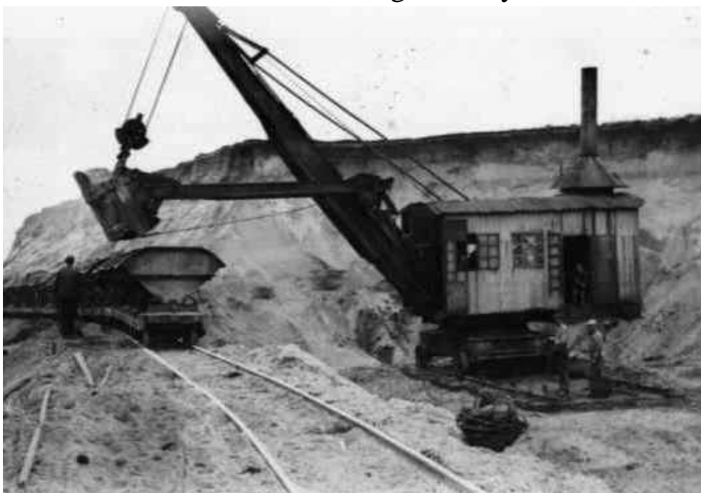
Læsning af tipvogne i brunkulslejerne

Men mange gode minder tog jeg med mig fra Søby. Tak for dem.