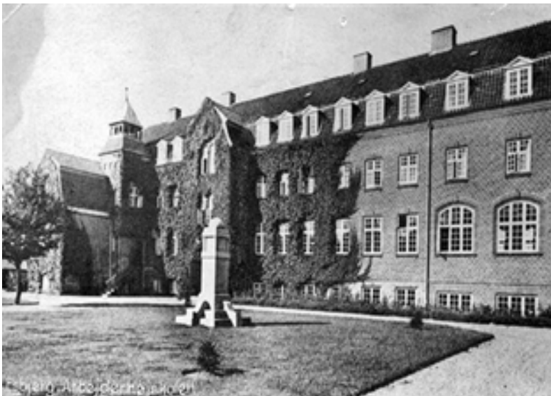
Arbejderhøjskolen ”Den røde Borg” på Gammel Vardevej - efter tilbygning.