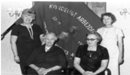
I forbindelse med vi bragte dette billede i ASRA NYT fik vi navnet på den sidste person på billedet