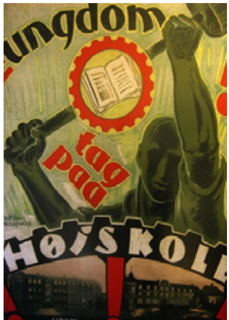
Fælles plakat for de to arbejderhøjskoler, Esbjerg og Roskilde i 1930'erne.