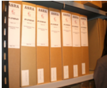
Alle arkivkasserne har vi været igennem