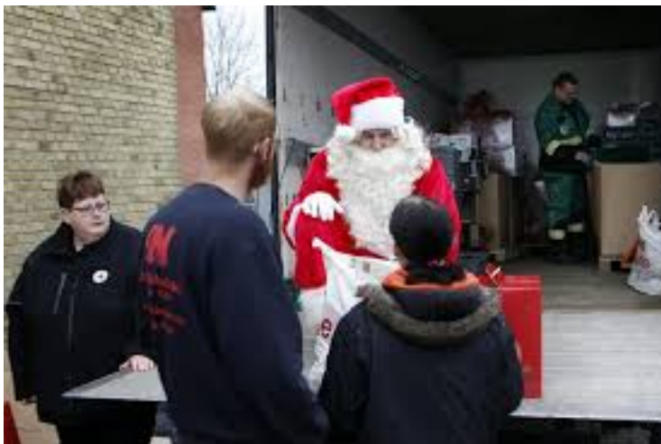
Fra uddelingen 2014