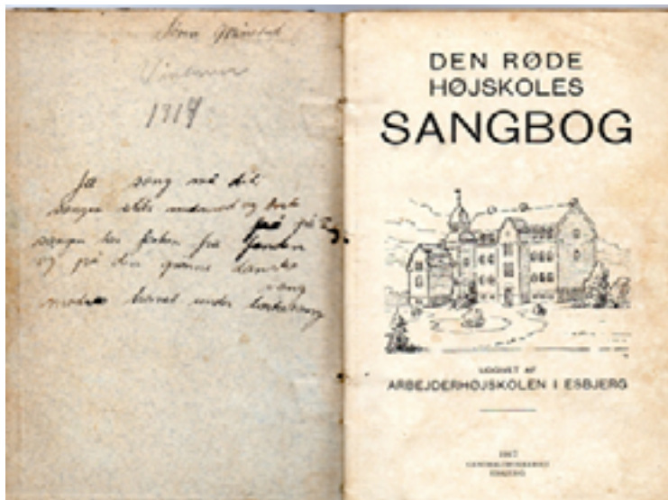
Titelbladet på den gamle sangbog, som er indbundet med stift bind, dog ikke rødt.

Det drejer sig om "Den røde Højskoles Sangbog", som blev udgivet af Arbejderhøjskolen i Esbjerg, første udgave i 1917 i forbindelse med indvielsen af den nye røde bygning på Gammel Vardevej.