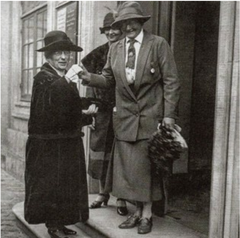
Til venstre på billedet Nina Bang - Danmarks første kvindelige minister - Hun blev Undervisningsminister i Stauning regeringen 1924 til 1926.