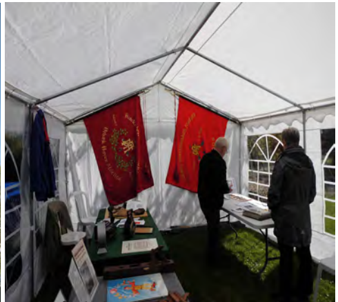
Alt på plads, værsgo' at kigge ind