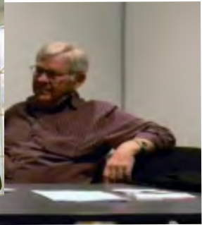
Generalforsamling i Holstebro 2010