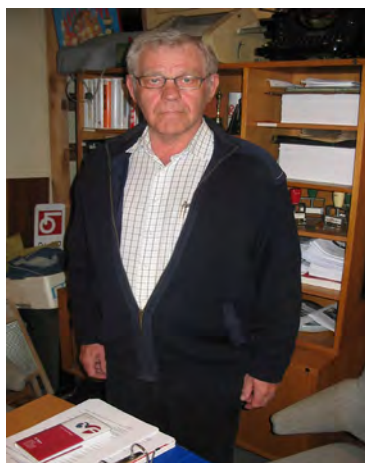
Klar til bestyrelsesmøde