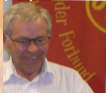
"Så er vi klar til at gå i gang"