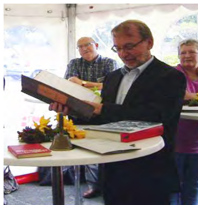
SAFORA protokollen overdrages til ASRA

lykkes at få de nye lokaler i ”Det Historiske Hus” ser jeg gerne, at værktøjet kommer op at hænge, så alle besøgende kan se det, da det er en unik samling. Jeg vil gerne endnu engang på ASRA’s vegne rette en stor tak til bidragsyderne. Som det kan læses et andet sted i bladet, så har jeg efter otte år i bestyrelsen, hvor de syv har været som formand, besluttet at stoppe som formand. Det har på mange måder været en god, spændende og begivenhedsrig periode, at være formand for ASRA. Som nyvalgt formand blev jeg kastet ud i en af de store opgaver, at markere foreningens 25 års jubilæum. Det blev med en fantastisk hjælp fra arkivholdet udarbejdet et jubilæumsudskrift, som på en god og fantastisk måde fortalt om ASRA’s første 25 år. I jubilæums-gave fra ABA, fik vi foræret en protokol fra SAFORA, så ASRA har nu alle protokoller fra den gang SAFORA Ringkøbing amt eksisterede.