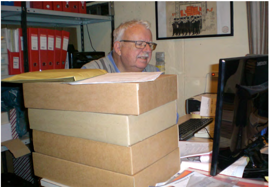
Inde bag alle arkivkasserne kan man skimte en travl arkivar.