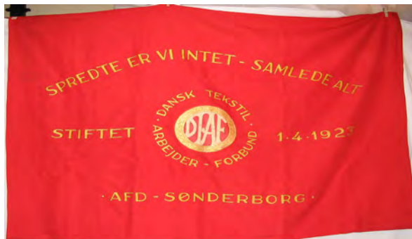
Fane fra Tekstilarbejdernes fagforening Sønderborg 1923

Vi omregistrerer og nyregistrerer i et væk. Al praktisk indretning er for længst afløst af et evigt flytten rundt for at skaffe en cm2 eller to, i ny og næ.