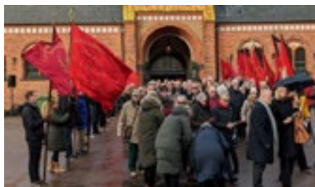
Faneborg uden for kapellet. Vestre kirkegård

at ligge ved siden af de store socialdemokratiske ikoner Thorvald Stauning, Hans Hedtoft, H.C. Hansen, Per Hækkerup og Anker Jørgensen.