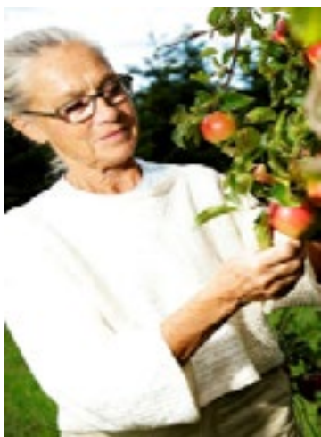
Sådan slappede Ritt af