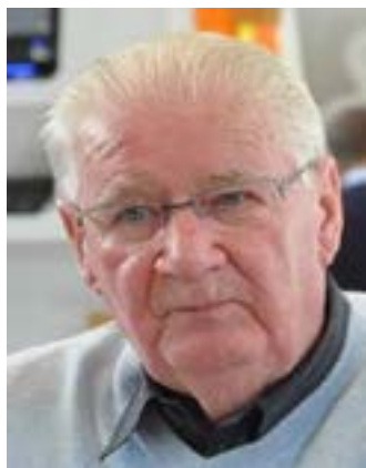
Jegge Erik Christensen

Så gik årene, som 15 årig i DSU og som 21 årig medlem af den socialdemokratiske partiforening i Herning, hvor jeg stadig er aktiv medlem.