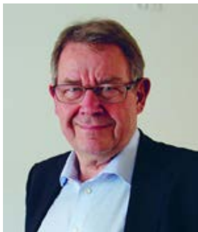
Poul Nyrup Rasmussen